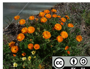
C. Gibert, Solagro. Plant de souci officinal ( Calendula officinalis ) à proximité d'une serre maraîchère dans le Lauragais (31).

Plante pérenne thérophyte dont la floraison débute au printemps et peut se poursuivre presque toute l'année. Son cycle de végétation s'établit sur moins d'un an.