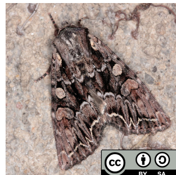
Storch H. Adulte de noctuelle du chou ( Mamestra brassicae ) [plus d'info]

Après l'éclosion, les larves restent groupées, se nourrissant des bords des feuilles sur lesquelles les œufs avaient été pondus. À partir du troisième stade larvaire, elles se dispersent sur toute la plante. La