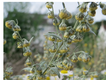
Andreas Rockstein, Flickr

La floraison a lieu de juillet à octobre.