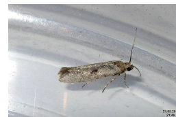
David Short, Flickr

Adulte : longueur au repos 6 à 7 mm pour une envergure de 14 mm environ. Les ailes antérieures sont grises à reflets argentés, parsemées de petites taches noires. Les ailes postérieures, uniformément grises, sont bordées d'une frange de petites soies. Le corps et les pattes sont recouverts d'écaillles grises à reflets argentés