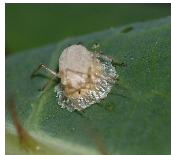
Momie de puceron parasité par Praon volucre