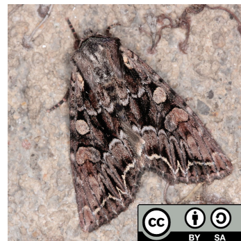
Storch H. Adulte de noctuelle du chou ( Mamestra brassicae ) [plus d'info]

Après l'éclosion, les larves restent groupées, se nourrissant des bords des feuilles sur lesquelles les œufs avaient été pondus. À partir du troisième stade larvaire, elles se dispersent sur toute la plante. La