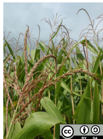
Champ de maïs ( Zea mays ).

La fleur mâle, qui s'épanouit au niveau du bourgeon terminal, est appelée panicule. La fleur femelle, située sur les bourgeons secondaires, forme les épis qui portent les grains. La taille d'un plan de maïs est comprise entre 2 et 4 mètres de haut. Sa tige mesure entre 5 et 6 cm de diamètre.