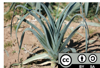
GOEAU H., 2013. Poireau ( Allium porrum ).

Le poireau est une plante bisannuelle maraîchère. Quand il est jeune et consommable, le poireau peut être considéré comme une plante en rosette (comme les choux et autres salades). Il a cependant une particularité. Les feuilles sont bien toutes insérées au même niveau et la tige est très courte. Cependant les feuilles sont formées d'une gaine cylindrique blanche (le blanc de poireau) puis au-dessus d'une partie verte. Les feuilles se séparent alors alternativement d'un côté puis de l'autre (feuilles alternes). La partie blanche de feuilles engainantes fait penser à une tige. Cette partie est blanche car elle était enterrée et privée de lumière (étiolée). Le bourgeon se trouve au centre, à la base, au-dessus d'une tige courte, le plateau. La structure est semblable à celle d'un oignon qui ne se serait pas élargi. - La France est le principal pays producteur européen. - La culture a généralement lieu en plein air. La récolte commence 5 à 7 mois après le semis, avant que la hampe florale ne se développe, et s'échelonne en fonction de la demande. - Il existe des variétés de printemps, d'automne et d'hiver. Les fleurs du poireau sont blanches ou carnées, en ombelle globuleuse multiflore très ample. Ses étamines sont saillantes, les 3 intérieures sont à 3 pointes, dont la médiane est 1 fois plus courte que son filet. Les anthères sont rougeâtres