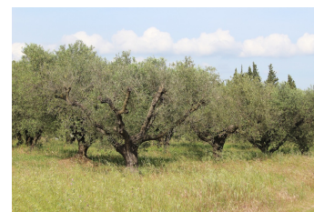
Verger enherbé d'oliviers (Alpes - mai 2014).