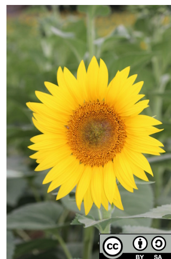
Inflorescence de tournesol ( Helianthus annuus ).

Débouchés : L'huile extraite des akènes vise des usages alimentaires et industriels, le tourteau est consommé par l'alimentation animale. Les graines peuvent également être utilisées en oisellerie, un marché de niche pour des variétés striées.