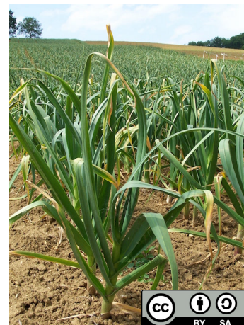
C Flameng, agriculteur. Champ d'ail cultivé ( Allium sativum ) en Tarn-et-Garonne.