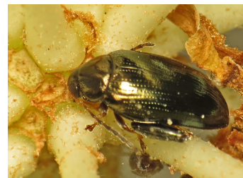
Martin Cooper, Flickr

Adulte : Il mesure entre 4 et 5 mm de long. Il est d'ordinaire noir aux reflets métalliques bleu-vert. Sa tête est roussâtre ; l'extrémité des antennes et des pattes antérieures est rousse. Il se caractérise par de grands fémurs postérieurs qu'il mobilise pour sauter. Les antennes ont dix segments. Œuf : Il est de forme ovale et de couleur orange pâle. Ses mensurations : 0,9-0,96 mm × 0,4-0,43 mm Larve : Il y a trois stades larvaires. Les larves mesurent jusqu'à 8 mm de long. Elles sont de couleur blanc crème avec 3 paires de pattes, une tête noire et une plaque dorsale noire sur l'extrémité de son abdomen. Les stades L1 et L2 sont tachetés de points noirs.