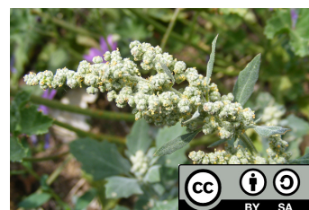
Calais JC, 2011. Fleurs du chénopode blanc ( Chenopodium album ).

Le fruit est un akène fin et membraneux qui contient une seule graine. La majorité des semences sont noires, rondes et lisses mais il existe 4 groupes de semences : brune lisse, brune réticulée, noire lisse et noire réticulée. Les graines ont des contours arrondi, aplaties, de 1 à 1,5 mm de diamètre. Enfermées dans une enveloppe très mince, membraneuse, lisse, blanchâtre, qui se fend facilement et tombe lorsqu'elle est sèche. Il existe deux types de graines, celles à enveloppe dure, qui sont dormantes, et celles à enveloppe souple, qui peuvent germer immédiatement. 1