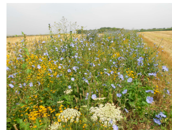
Bande fleurie à base de chicorée sauvage, anthémis, carotte sauvage.

L'idéal est d'implanter la bande fleurie en connexion avec d'autres IAE pour assurer le maillage écologique à l'échelle de l'exploitation (haies, fossés, bandes enherbées...)