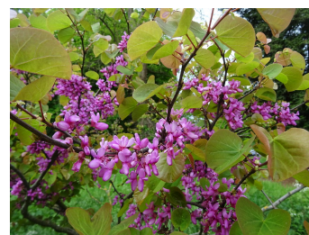
Fleurs et feuilles de l'Arbre de Judée, Cercis siliquastrum

La période de floraison s'étend d'avril à mai.