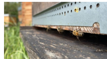
Abeilles mellifères à l'entrée d'un rucher.

Apis mellifera , également connue sous d'autres noms communs tels que l'abeille domestique, l'abeille européenne ou encore l'abeille mellifère, est une espèce d'insecte de l'ordre des Hyménoptères, appartenant à la famille des Apidés. Cette espèce est considérée comme étant un pollinisateur significatif en raison de son efficacité et de sa grande disponibilité, et économiquement précieuse pour les monocultures dans le monde entier 1 . Pourtant, elle ne représente qu'une seule espèce, parmi les 1000 espèces d'abeilles sauvages présentes en France 2 .