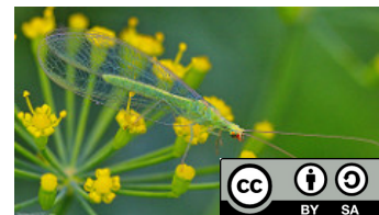
Rouzet P, 2017. Adulte de la demoiselle aux yeux d'or ( Chrysoperla carnea ).

L'espèce Chrysoperla carnea est utilisée en lutte biologique, essentiellement contre les pucerons.